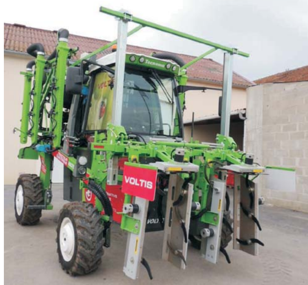
Rys. 6. Elektryczny ciągnik szcudłowy Tecnom a Voltis [3]