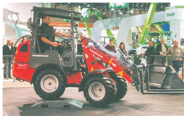
Rys. 7. Elektryczna ładowarka kołowa Weidemann 1160 eHoftrac [11]

Ładowarka Weidemann 1160 eHoftrac (rys. 7) wyposażona jest w elektryczne silniki: trakcyjny o mocy 6,6 kW oraz do obsługi hydrauliki roboczej maszyny o mocy 9 kW.