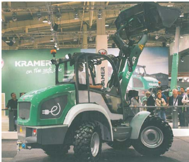
Rys. 8. Elektryczna ładowarka kołowa Kramer eKL19.5 [11] Fig. 8. Electric wheel loader Kramer eKL19.5 [11]

Ładowarka elektryczna firmy Kramer eKL 19.5 (rys. 8) zbudowana na platformie modeli KL19.5 ma udźwig 2000 kg. W zależności od sposobu użytkowania i obciążenia może pracować od 2 do 5 godzin. Ładowanie akumulatorów trwa około 8 godzin i możliwe jest bezpośrednio z gniazda 230 V [11].