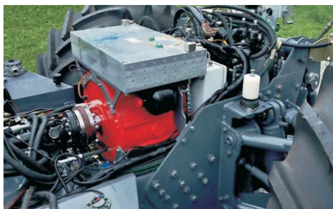
Rys. 1. Ciągnik Rigitrac EWD 120 [10]