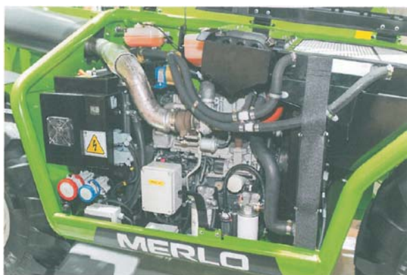
Rys. 4. Zespół napędowy ładowarki Merlo Turbofarmer 42.7 Hybrid [3]

nerator zasilający silniki układu jezdnego umieszczone w kochach maszyny. Średnie zużycie paliwa ładowarki hybrydowej jest o co najmniej 30% mniejsze w porównaniu ze standardowymi ładowarkami napędzanymi tylko silnikami ZS [3].