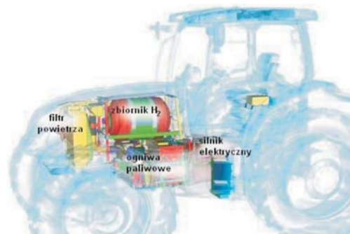
Rys. 10. Widok i schemat rozmieszczenia układów ciągnika New Holland NH 2 [3] Fig. 10. View and diagram of units' arrangement in tractor New Holland NH 2 [3]

Zbiornik mogący pomieścić 8,2 kg wodoru pod ciśnieniem 350 bar zapewnia do 3 godzin autonomicznej pracy. Ciągnik wyposażony w nową przekładnię bezstopniową może rozwijać prędkość do 50 km·h -1 , a jego układ hydrauliczny zapewnia wydatek oleju do 113 dm 3 ·min. Najistotniejszym parametrem ekologicznym ciągnika NH 2 jest zerowa emisja zanieczyszczeń w trakcie użytkowania.