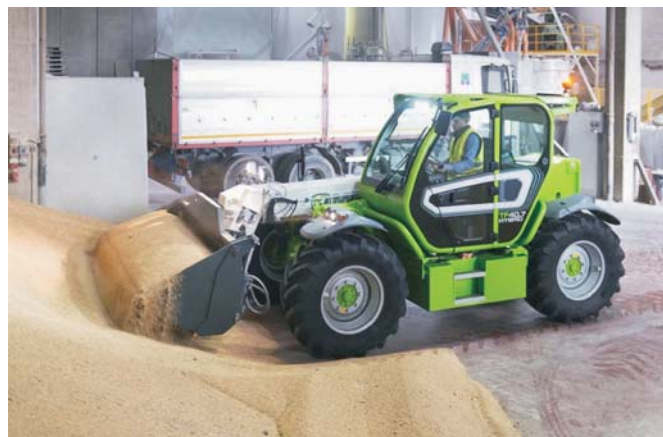
Rys. 3. Ładowarka teleskopowa Merlo Turbofarmer 42.7 Hybrid [3]

Włoska firma Merlo opracowała całą rodzinę hybrydowych ładowarek teleskopowych Turbofarmer 40.7 Hybrid, Turbofarmer 42.7 Hybrid i najnowszą Turbofarmer TF 38.10 TT Hybrid o maksymalnym udźwigu 3800 kg i maksymalnej wysokości podnoszenia 9,6 m. Ładowarka Merlo Turbofarmer 42.7 Hybrid (rys. 3 i 4) wyposażona jest w silnik ZS o mocy 56 kW wspomagany przez silnik elektryczny. Układ taki zastępuje stosowany w konwencjonalnych ładowarkach silnik ZS o mocy 100 kW. Maksymalny udźwig tego modelu wynosi 4200 kg, a maksymalna wysokość podnoszenia 7,1 m. Ładowarki mogą pracować w trybach Eco (4 godziny) i w pełni elektrycznym (2 godziny). W trybie Eco silnik spalinowy napędza pompy hydrauliczne zasilające układ wysięgnika i ge-