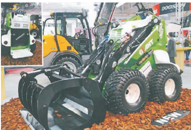
Rys. 9. Elektryczna ładowarka Giant Concept ze sterowaniem burtowym [11] Fig. 9. Electric wheel loader Giant Concept [11]

W wiele nowatorskich rozwiązań układu napędowego wyposażony jest, zaprojektowany przez firmę New Holland, ciągnik NH 2 (rys. 10) [2, 3, 4] zasilany energią elektryczną wytworzoną w ogniach paliwowych, dla których paliwem jest wodór. Zbudowany w 2011 roku i przetestowany podczas prac polowych prototyp jest rozwiniętą konstrukcją wcześniejszego modelu koncepcyjnego. Ciągnik NH 2 zbudowany na bazie modelu T6.140 wyposażono w ogniwa paliwowe o mocy 100 kW. Jeden z silników elektrycznych zapewnia napęd układu jezdny, a drugi WOM i układów pomocniczych. Każdy z nich ma moc 100 kW i ciągły moment obrotowy wynoszący 950 Nm. Sprawność silników przy maksymalnej mocy wyjściowej wynosi około 96%.