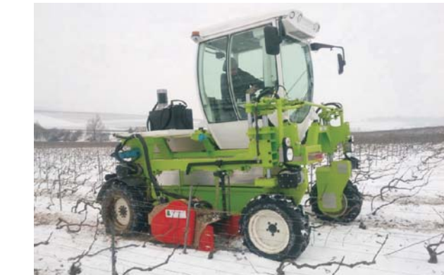
Rys. 5. Elektryczny ciągnik szcudłowy Kremer T4E [3]