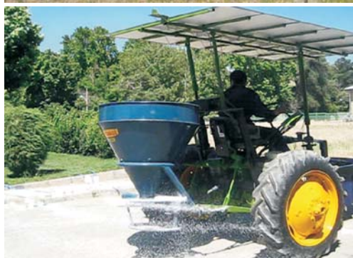
Rys. 11. Model ciągnika elektrycznego zbudowany w ramach projektu SAPHT [5] Fig. 11. Model of electric tractor developed within SAPHT project [5]