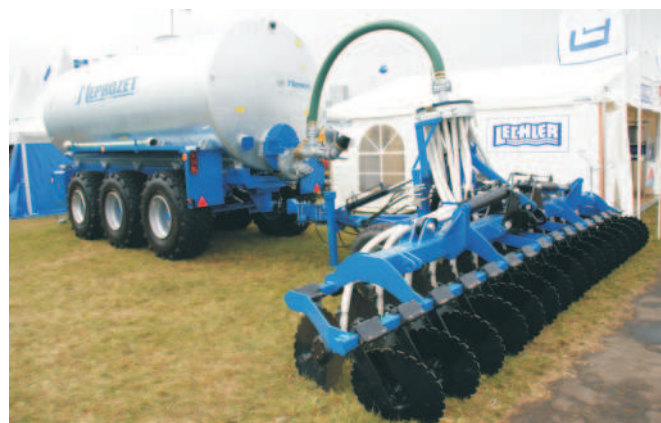
Rys. 10. Nowe rozwiązanie aplikatora doglebowego firmy Meprozet z Kościana

Na ostatnich targach AgroShow 2008 krajowi producenci wozów asenizacyjnych, MEPROZET Kościana (rys. 10)