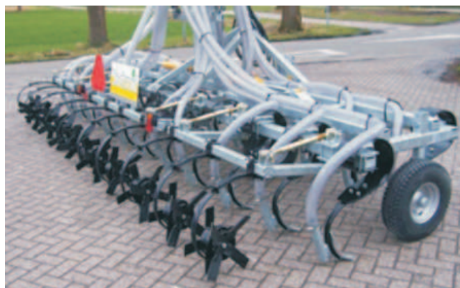
Rys. 9. Aplikator doglebowy z sekcjami gwiazdowymi (firma Slootsmid) [1]

Na ostatnich targach AgroShow 2008 krajowi producenci wozów asenizacyjnych, MEPROZET Kościana (rys. 10)