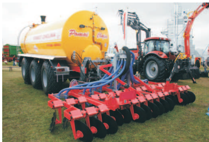
Rys. 11. Nowe rozwiązanie aplikatora doglebowego firmy Pomot z Chojny

i POMOT Chojna (rys. 11), zaprezentowali nowe rozwiązania wozów z aplikacją doglebową gnojowicy z wykorzystaniem sekcji bron talerzowych. W obydwu rozwiązaniach aplikator jest składany w położenie transportowe za pomocą siłowników hydraulicznych.