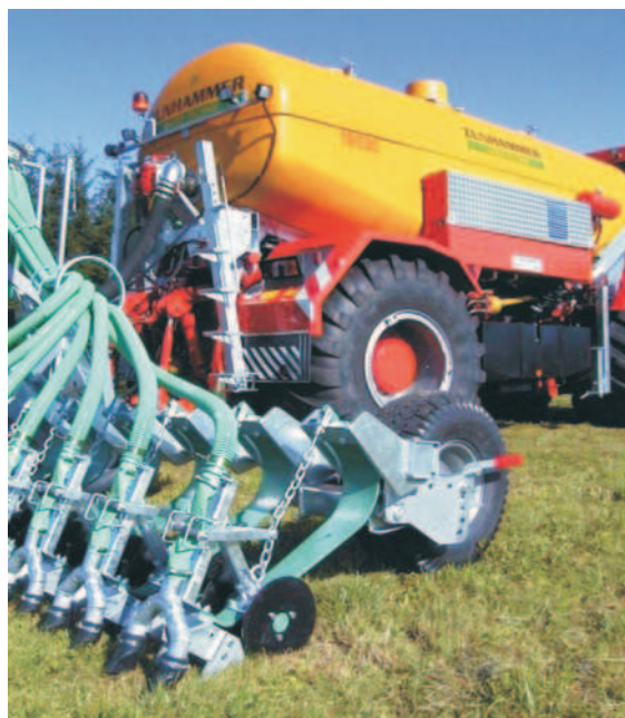
Rys. 1. Mocowanie aplikatora na sprężynie zabezpiecza go przed uszkodzeniem (firma Zunhammer) [1]

dwóch głębokościach: płytko - od 5 do 10 cm i głęboko - do 15 cm. Płytkie aplikowanie gnojowicy z zasypywaniem jest bardziej skuteczne niż z otwartymi rowkami, ponieważ obniża emisję amoniaku. Aplikatory do głębokiego zadawania gnojowicy zbudowane są na bazie istniejących narzędzi: kultywatorów lub bron talerzowych. Narzędzie jest zawieszane lub przyczepiane z tyłu wozu asenizacyjnego a gnojowica jest podawana do rozdzielacza umiejscowionego na narzędziu. Można spotkać również rozwiązania, w których aplikator doglebowy zawieszony jest bezpośrednio na ciągniku, a zasilanie gnojowicą odbywa się za pomocą węża elastycznego ze zbiornika lub wozu asenizacyjnego. Stosowanie aplikatorów gnojowicy w glebę z równoczesnym przykryciem skutkuje znacznym obniżeniem emisji amoniaku i odorów. Skuteczność tego zabiegu uzależniona jest od rodzaju zastosowanej maszyny.