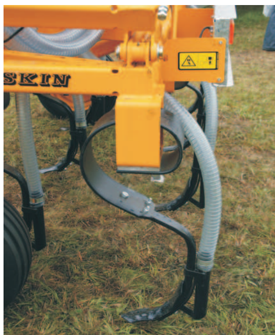
Rys. 3. Sprężysty aplikator doglebowy firmy Joskin [1]

Firma Joskin [1] oferuje dwa aplikatory doglebowe wyposażone w sztywne i sprężyste zęby kultywatora. Zęby sztywne (od 7 do 13 w zależności od wersji) wyposażone są w gęsiostopkę o szerokości roboczej od 14 do 24 cm. Do trzonu zęba przymocowana jest rura metalowa, która jest zasilana od rozdzielacza przewodem elastycznym i podaje gnojowicę w strefę gęsiostopki, która penetruje glebę. Ten system umożliwia pracę na głębokości 10-12 cm. Głębokość roboczą reguluje się kołami podporowymi mocowanymi do pierwszej belki aplikatora. Każdy z zębów wyposażony jest dodatkowo w indywidualną regulację głębokości, której dokonuje się przez zmianę otworów w uchwycie (3 punkty położenia). Użytkownik może również zmienić kąt pracy zębów przez zmianę ich położenia na belce (3 pozycje). Firma Joskin wyposaża również aplikatory doglebowe w zęby sprężyste (rys. 3). W tym przypadku dzięki efektowi wibracji zęba uzyskuje się lepszą jakość pracy zębów. System ten umożliwia aplikowanie gnojowicy na głębokości 12-15 cm. Zasada pracy jest taka