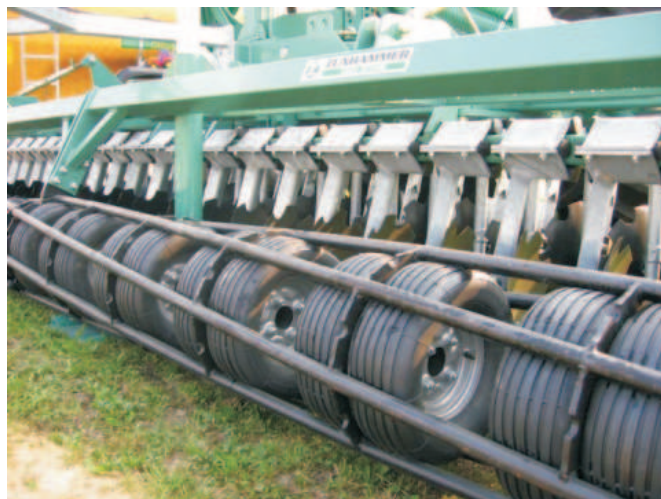
Rys. 8. Nowe rozwiązanie wału strunowego-oponowego (firma Zunhammer) [1]

przebieżeniowych, które umożliwiają uniesienie się talerza na kamieniu. Gnojowica aplikowana jest bezpośrednio przy talerzach w pierwszym rzędzie, a przykryta zostaje glebą przesuniętą przez drugi rząd talerzy. Firma Zunhammer proponuje do współpracy z broną wał oponowy z rurkowymi strunami (rys. 8). Wyrównuje on powierzchnię spulchnionej gleby i umożliwia jej dociśnięcie. Inne rozwiązanie przykrycia gnojowicy proponuje firma Slootsmid, która w swym rozwiązaniu stosuje sekcje gwiazdowe (rys. 9).