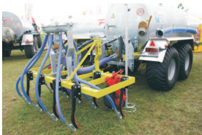
Rys. 6. Aplikator doglebowy na bazie zębów sztywnych firmy POMOT Chojna

Drugi system stosowany w aplikatorach doglebowych polega na wykorzystaniu bron talerzowych. Oferują go firmy Jeantil i Zunhammer (rys. 7). W systemie tym na ramie bron nabudowany jest rozdzielacz, który równomiernie podaje gnojowicę do węży elastycznych, które doprowadzone są do rur metalowych. Rury metalowe mocowane są do trzonów talerzy na pierwszej belce bron. Talerze mocowane są na belkach najczęściej za pomocą obejm i gumowych wkładek