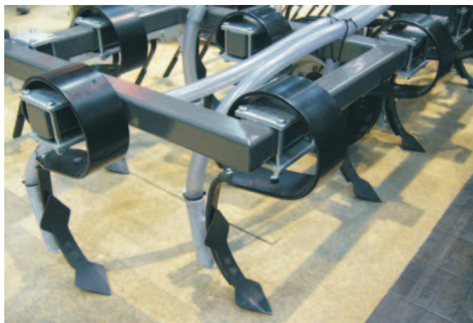
Rys. 2. Mocowanie na sprężynach spełniających funkcję zabezpieczenia przeciążeniowego (firma Kaveco, Agritechnica 2007)

cza 3,35 lub 4,4 m), 13 (szerokość robocza 5,2 m), 15 (szerokość robocza 6,0 m), 17 (szerokość robocza 4,5 lub 6,0 m), 19 (szerokość robocza 5,10 m), 21 (szerokość robocza 5,5 m), 25 (szerokość robocza 6,5 m).