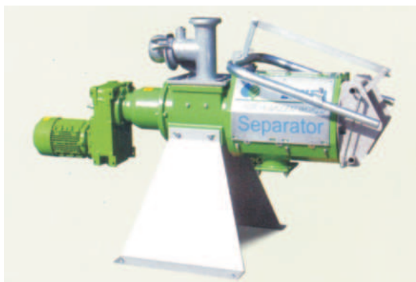
Rys. 12. Separator gnojowicy S 655 firmy Bauer [1]

Separator posiada obudowę stalową (rys. 12), w której umieszczony jest ślimak i sito. Część płynna gnojowicy jest wytlaczana przez sito szczelinowe, z kolei część stała transportowana jest przez ślimak do wylotu. Wydajność urządzenia można zwiększyć przez zastosowanie sit z większymi szczelinami. W ofercie znajdują się sita szczelinowe 0,3; 0,5; 0,75; 1,0 mm. Zawartość części stałych w odseparowanej gnojowicy można zmienić przez zmianę gęstości sit. Separator napędzany jest silnikiem elektrycznym. Jego wydajność zależna jest od rodzaju gnojowicy i wynosi dla gnojowicy bydłowej od 20 do 30 m 3 /h, dla gnojowicy świńskiej od 25 do 35 m 3 /h.