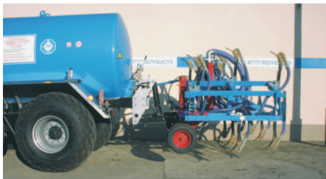
Rys. 5. Ekologiczny wóz asenizacyjny T550/18 do wglębnego dozowania gnojowicy firmy POMOT Chojna

środkowej ramy zamocowanych jest 8 zębów, w sekcjach bocznych po 3 zęby. Szerokość robocza aplikatora z 14 zębami wynosi 4,98 m. Wóz asenizacyjny może pracować samodzielnie po odłączeniu adaptera. Wówczas można rozlewać gnojowicę powierzchniowo przez założenie łyżki rozbryzkowej lub ramy z węzami wleczonymi.