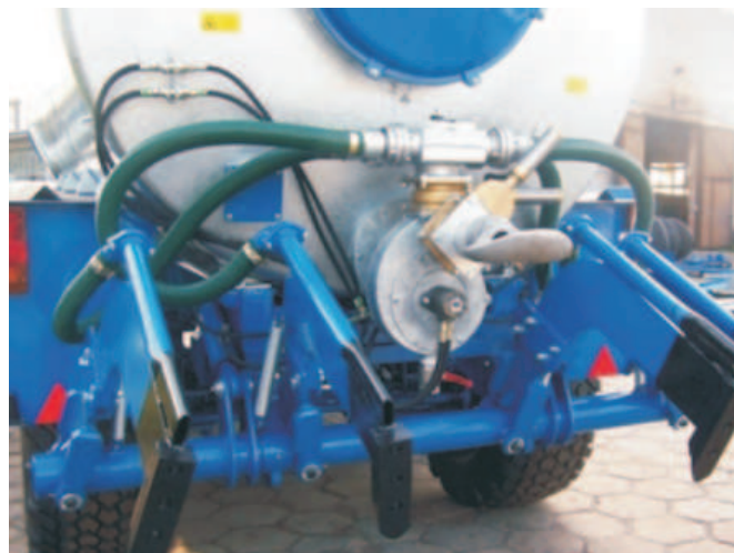
Rys. 4. Ekologiczny wóz asenizacyjny PW-2/24A wyposażony w aplikator doglebowy firmy MEPROZET Kościan [1]

Ponadto wóz wyposażony jest w urządzenie rozdrabniające części stałe, które znajduje się na wlocie do zbiornika.