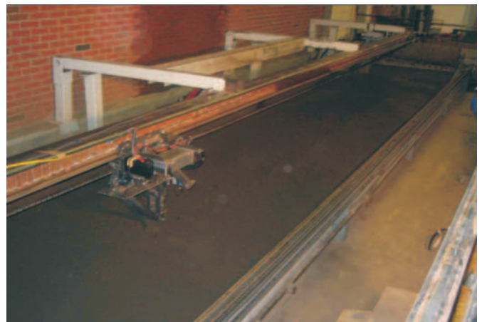
Rys. 2. Kanał glebowy z wózkiem do badań narzędzi przemieszczających się z dużą prędkością [4]

Badania zależności siły uciągu od prędkości roboczej prowadzono również z użyciem narzędzi uprawowych. Badania pługa odkładnicowego w kanale glebowym przy prędkościach 1-4 m/s (3,6-14,4 km/h) wykazały wzrost siły uciągu wraz ze wzrostem prędkości. Przyrost siły uciągu był różny w poszczególnych zakresach prędkości roboczej. Badający przyjęli wzrost siły uciągu jako liniowy dla praktycznie i ekonomicznie uzasadnionych prędkości stosowanych w zabiegach uprawowych. W trakcie prowadzonych prób zaobserwowano zwiększone rozdrobnienie gleby wraz ze wzrostem prędkości oraz przez zastosowanie przedłużenia odkładnicy i zapłuzka [40].