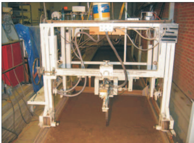
Rys. 3. Wózek do badań narzędzi przemieszczających się w kanale glebowym z małą prędkością [4] Fig. 3. Low speed tool carriage [4]

W PIMR podjęto badania trwałościowe lekkich zębów kultywatorów stosowanych w aktualnie produkowanych maszynach. Badania stanowiskowe zębów z obciążeniami odpowiadającymi prędkościom 12, 15 i 20 km/h wykazały ich niższą kilkukrotnie trwałość w porównaniu do obciążeń występujących przy obecnie stosowanych prędkościach nieprzekraczających 10 km/h [28]. Podobne badania gęsiostopki z ostrzami napawanymi różnymi materiałami przeprowadzono na specjalnie skonstruowanym do badań trwałościowych, kołowym kanale glebowym. Największą trwałość wykazały gęsiostopki z krawędziami napawanymi materiałem zawierającym węgiel wolframu. Ich zużycie było 4 krotnie mniejsze niż gęsiostopki nienapawanymi. Zaobserwowano ponadto zmniejszenie się siły uciągu po przebiegu 74 km w wyniku zjawiska samoostwienia krawędzi napawanymi [45]. Inne prace nad wykorzystaniem nowych materiałów w konstrukcji maszyn przeprowadzili Kogut i Ptaszyński [23]. Wykorzystali oni do polowych badań porównawczych pługa odkładnicze metalowe oraz wykonane z uretanu. Stwierdzono, że w miarę wzrostu prędkości orki rośnie opór dla korpusów całkowicie metalowych, wyraźnie natomiast maleje dla korpusów ze skrzydłami odkładnic z uretanu. Przy prędkości orki 1,9 m/s opór ten stanowi 30 % jednostkowego oporu orki korpusami z metalowymi odkładnicami.