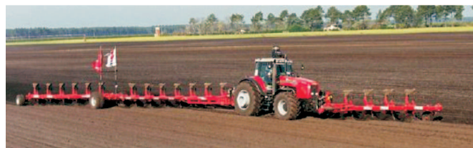
Rys. 4. Ciągnik MF 8280 Xtra z pługami Gregoire Besson SPSF9 w trakcie bicia rekordu świata w orce w 2001 roku Fig. 4. World record by ploughing 2001 tractor MF 8280 Xtra and ploughs Gregoire Besson SPSF9

Jednym z przejawów praktycznego wykorzystania, choć części z powyższych badań i analiz są próby bicia rekordów świata w orce. W 2001 roku pobito rekord świata w orce 24 godzinnej. Wynosił on 251,37 ha i należał do zestawu składającego się z ciągnika MF 8280 Xtra i dwóch pługów obracalnych, półzawieszanych, przegubowych Gregoire Besson SPSF9.